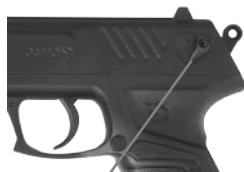
Cran de sûreté

Enclencher le cran de sûreté vers le haut, vers la lettre "S", un point rouge apparaîtra.