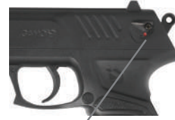
Cran de sûreté

Enclencher le cran de sûreté vers le bas, vers la lettre "F", le point rouge disparaîtra.