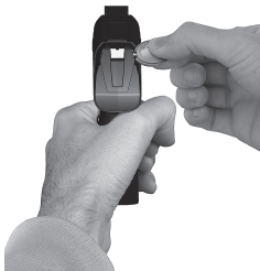
REGULACIÓN DEL ALZA REARSIGHT ADJUSTMENT REGLAGE DE LA HAUSSE VISIEREINSTELLUNG REGULAÇÃO DA ALÇA